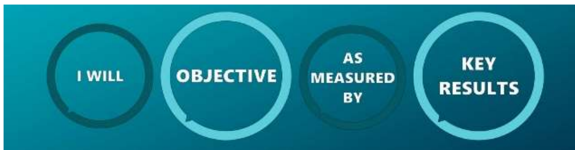
Figura: Esquema metodologia OKR.

Para a construção dos objetivos da atuação internacional por macrotema, foi utilizada a metodologia OKR 5 , sigla do inglês para “ Objectives and Key Results ” (Objetivos e Resultados-Chave), que consiste em um método de gestão por resultado e não por trabalho, baseado em objetivos e resultados-chave. O foco compreende o monitoramento, em nível estratégico, dos resultados mais importantes e significativos da atuação internacional.