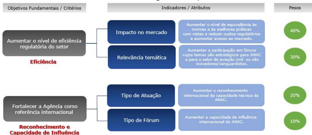
Fluxograma II – Objetivos Fundamentais das missões de representação institucional internacional e Indicadores da Metodologia de Priorização

Com base nessa análise, foram elaborados quatro indicadores para priorização das missões de representação institucional internacional.